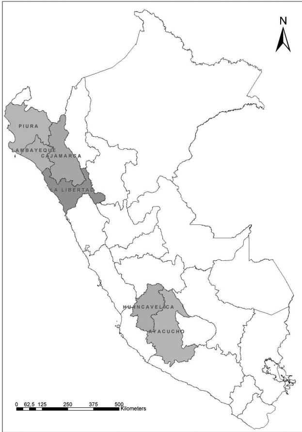
Cuadro 3.1: Regiones de intervención del FPA en la primera fase